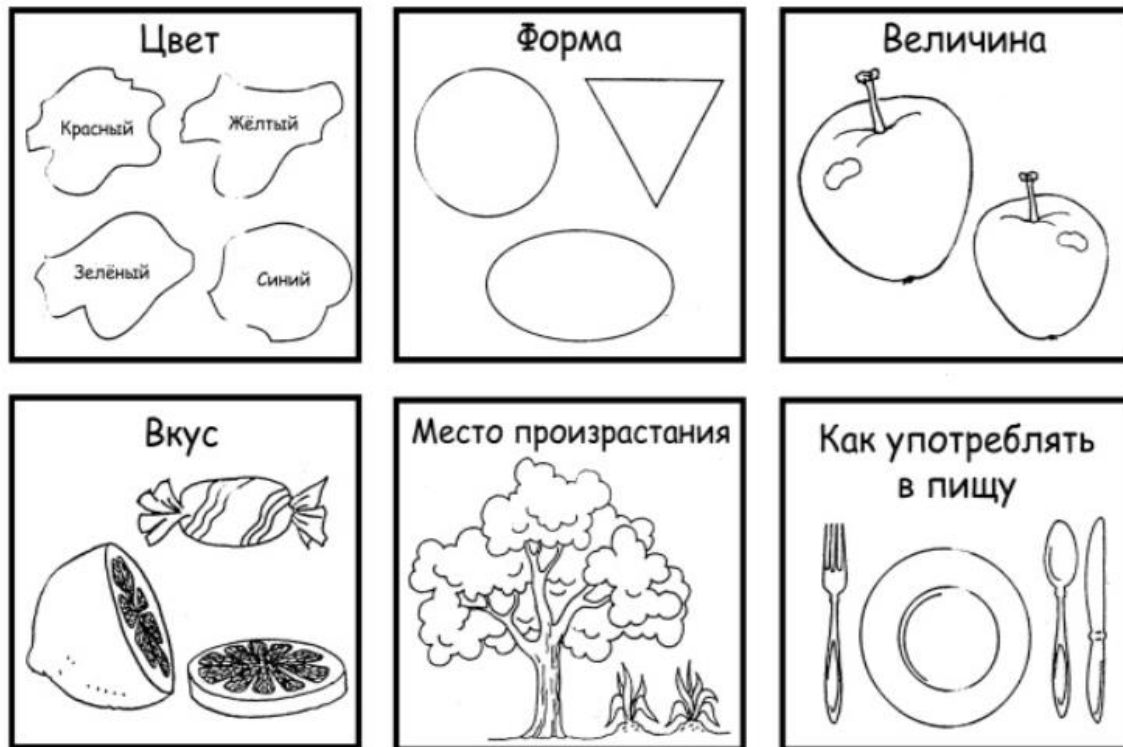
Схема описания и сравнения овощей, фруктов.